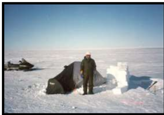
Uno de los exploradores en Patriot Hills y el fondo de la foto indica el Polo Sur.

En este punto, y luego de armar carpa, la patrulla de la Escuela de Montaña se integró a los trabajos propios del funcionamiento del campamento de la empresa ANI y en los días posteriores, inició las pruebas de equipo y de material efectuando marchas hacia los montes Ellsworth, distantes unos 5 kilómetros de Patriot Hills.