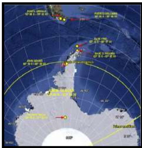
Foto satelital que ilustra lugares de referencia.