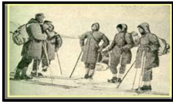
Expedición en las cercanías de Base O'Higgins (1948)