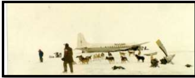
Avión DC – 6 siniestrado junto a perros que participarían en la última expedición al Polo Sur.