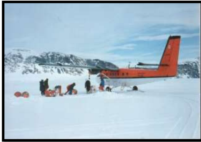
Avión Twin Otter junto a la tripulación en el glaciar de John Sound, en proceso de carga de tambores de combustible.

De todas las experiencias obtenidas por los exploradores, les llamó especialmente la atención las rigurosas condiciones climáticas de la zona: temperaturas bajo cero y vientos intensos permanentes, que superaban los 100 k por hora en dirección norte. Esto les permitió concluir que el vestuario y equipo empleado –que estaba en uso en las unidades de montaña- no era el apropiado; se debería adquirir vestuario y equipo de la mejor calidad que ofrecieran los mercados; y estudiar, con especial acuciosidad, la alimentación, considerando el peso, volumen y valor nutritivo de la dieta.