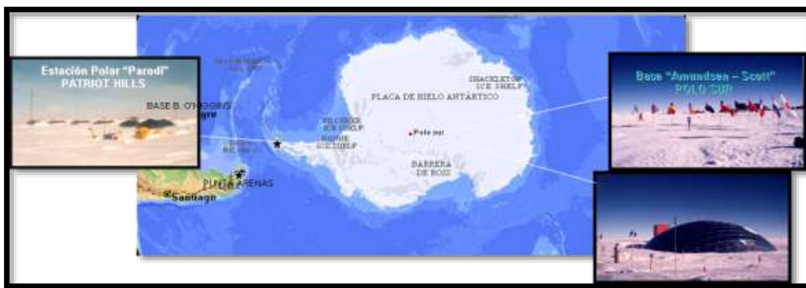
Ruta de marcha de Patriot Hills al Polo Sur.