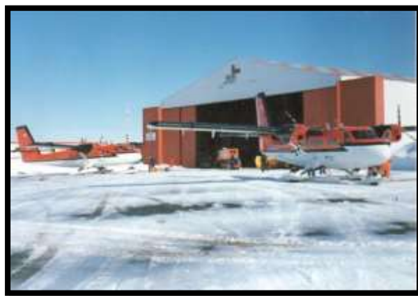
Aviones empleados en la expedición en proceso de reabastecimiento de combustible en el aeródromo Teniente March de la FACH.

A las 10:00 h del 14 de octubre se inicia la expedición en dos aviones Twin Otter, en vuelo directo de 4 horas desde Punta Arenas a Base Frei. El equipo expedicionario fue recibido en el aeródromo Teniente March por el comandante de la Base Frei y una delegación de oficiales de la Fuerza Aérea de Chile, quienes les dan la bienvenida. Como las condiciones climáticas eran buenas –sin viento y con cielo despejado- los aviones fueron reabastecidos de combustible y el vuelo se reinició aproximadamente a las 16:00 h en dirección al glaciar John Sound, pasado el círculo polar antártico y próximo a la Base Rothera del gobierno británico.