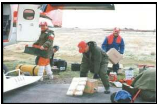
Integrantes de la expedición en faena de carga del avión Twin Otter en Punta Arenas.