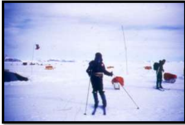
La expedición en el inicio de la marcha al Polo Sur en el sector de Patriot Hills.

La expedición, sin apoyo externo, inició su marcha desde Patriot Hills el 14 de noviembre de 1995, teniendo como objetivo llegar al Polo Sur Geográfico, ubicado a 2.900 metros sobre el nivel del mar, lo que significó marchar 1.280 kilómetros contra el viento y en permanente ascenso; después de 51 días de marcha esta culminó con pleno éxito, y de acuerdo a lo planificado, el día 4 de enero del 1996 19 .