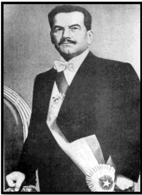
Presidente Don Pedro Aguirre Cerda

Más tarde, el General Ramón Cañas Montalva creó y desarrolló nuevos conceptos geográficos-políticos de trascendencia, que tuvieron la virtud de modificar las imágenes mentales de nuestra clase gobernante, una de cuyas concreciones fue la consolidación de una política antártica nacional 4 . Así, apreciando en forma proactiva la importancia que iba adquiriendo el continente blanco, el Presidente don Pedro Aguirre Cerda, el año 1940, precisa los límites del Territorio Antártico Chileno, que se extiende hasta el Polo Sur, entre los meridianos 53° y 90° de latitud oeste 5 .