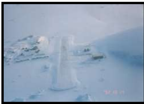
Vista aérea Base Rothera

A las 10:00 h del 14 de octubre se inicia la expedición en dos aviones Twin Otter, en vuelo directo de 4 horas desde Punta Arenas a Base Frei. El equipo expedicionario fue recibido en el aeródromo Teniente March por el comandante de la Base Frei y una delegación de oficiales de la Fuerza Aérea de Chile, quienes les dan la bienvenida. Como las condiciones climáticas eran buenas –sin viento y con cielo despejado- los aviones fueron reabastecidos de combustible y el vuelo se reinició aproximadamente a las 16:00 h en dirección al glaciar John Sound, pasado el círculo polar antártico y próximo a la Base Rothera del gobierno británico.